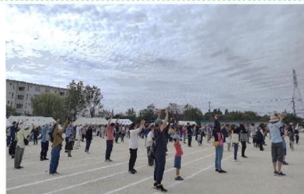
開会式・選手宣誓&ラジオ体操