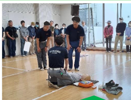
AED 操作&心肺蘇生訓練