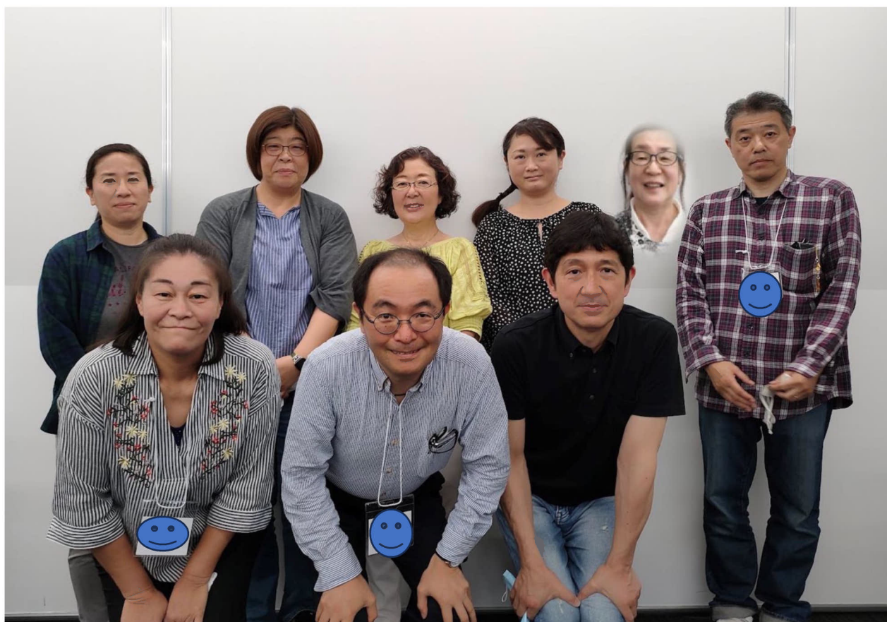
2023 年度きよみ野西自治会ブロック長のみなさん

今回承った監事の仕事は、きよみ野西地区の地域活動全体が見える立ち位置かと思っています。難しいことよりも、より身近な視点に立って自治会運営をする活動が出来ればと思っています。至らぬところもあると思いますが、1 年間よろしくお願いいたします。