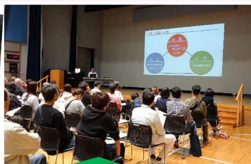
危機管理課職員による出前講座