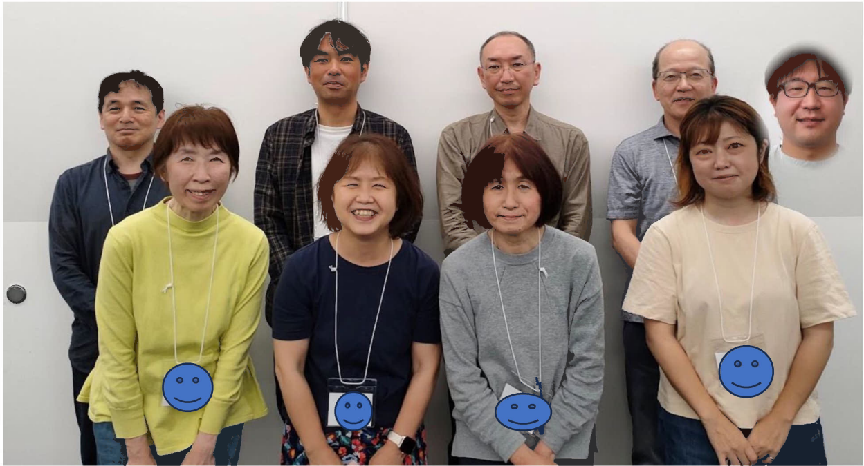
2023 年度きよみ野西自治会役職長のみなさん