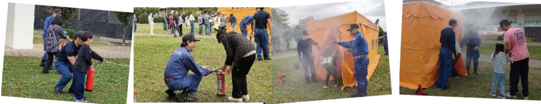
消火器訓練&煙ハウス体験

元旦には能登半島で最大深度7の地震が発生し、改めて災害への備えの大切さを実感しています。今回のきよみ野西便りは出前講座で紹介された災害用備蓄や災害時の行動についてお知らせします。詳しくは埼玉県ホームページ『防災マニュアルブック』をぜひご確認ください。